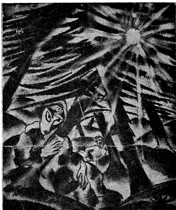
א וואכנאכט אין וואלד